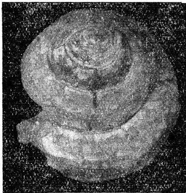
Fig. 1. Pleurotomaria ( Entemnotrochus ) gigas (Bors.)

U w a g i: Istnieje jedyna możliwość porównania naszego okazu z opisanym przez S a c c a (1897) pochodzącym z Elveziano góry Tortona. Gatunek ten pozornie przypomina wielkiego współczesnego morskiego ślimaka Tugurium pozbawionego paska fissurowego. Pl. gigas znany był pod nazwą Trochus gigas B o r s. Thiele (1931) podaje, iż dziś żyjący przedstawiciele rodzaju Pleurotomaria zamieszkują głębsze wody w rejonie zachodnich Indii, Japonii i Molukków. Prawdopodobnie jednak morze miocenne na G. Śląsku w podpiętrze opolianu, wnioskując z całokształtu makrofauny m. in. koralii osobnikowych, nie przekraczało głębokości szelfu.